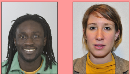
Bouche ouverte, dents visibles Bouche non fermée