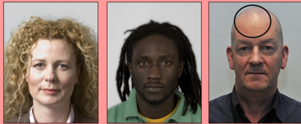
Surexposé Sous-exposé Reflets et ombres