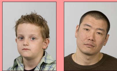
De travers et épaules pas droites Penché (yeux pas horizontaux)