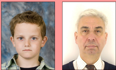
Fond pas uni Contraste insuffisant cheveux/fond