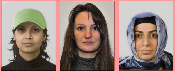
Tête couverte Visage et yeux pas entièrement visibles Visage pas entièrement visible