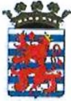
VILLE D'ARLON Belgique